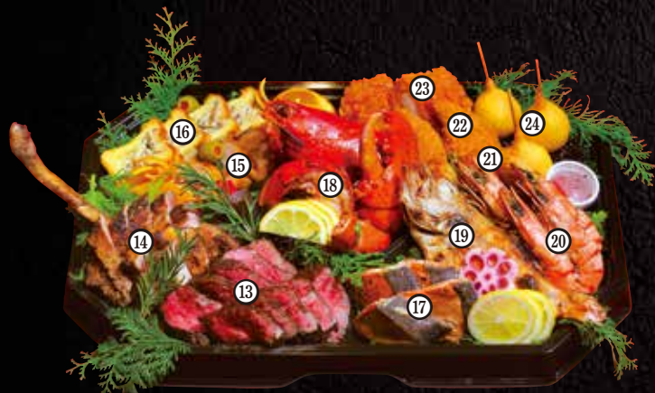
オードブルの容器サイズ:縦27cm×横42cm